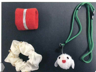
ネームサインの例

自分が誰なのか、名前の印や合図を決めて、必ずそれを使って子どもに名乗ることが大切です。誰が来たのか、特定できる情報を提供しましょう。個人を特定する物(たとえば、タオル地のアームバンド、ビーズの腕輪、ふわふわの髪飾り、色鮮やかなエプロンなど)を身につけて、判別できるように心がけましょう。決まった物や香り人と結びつくように、いつも同じ物にしましょう。そして、そばにいるのかいないのかわからないので、そばに来たことをきちんと伝え、そばを離れる時は離れることも伝えましょう。