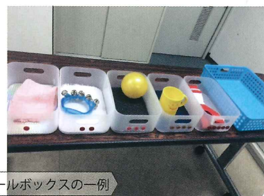
スケジュールボックスの一例

見通しをもって、安心して活動するために、次の活動や行く場所をかならず予告しましょう。活動の予告、一日の見通しとして、その活動を象徴する物(オブジェクトキュー)やスケジュールボックスを活用します。オブジェクトキューは、子どもにとって、活動をイメージしやすい物を使用します。